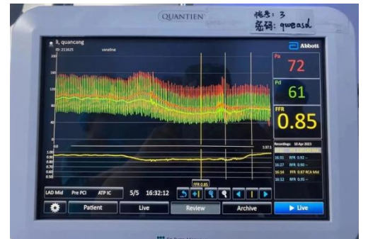
左前降支 FFR 数值

精准医疗是一种新型医学概念和医疗模式。冠脉血流储备分数已经是评价心肌缺血的“金标准”，具有精准、高效的领先优势，诊断准确度高，对准确评价冠脉狭窄对远端血流的影响，了解冠状动脉狭窄与心肌缺血的关系，高效地判断患者是否适合心脏支架介入手术，进而制定合理的治疗决策，优化患者预后，起到重要的指导作用，可最大程度节约医疗资源，造福更多患有心血管疾病的患者。